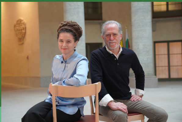
Miljöpartiets språkrör Amanda Lind och Daniel Helldén